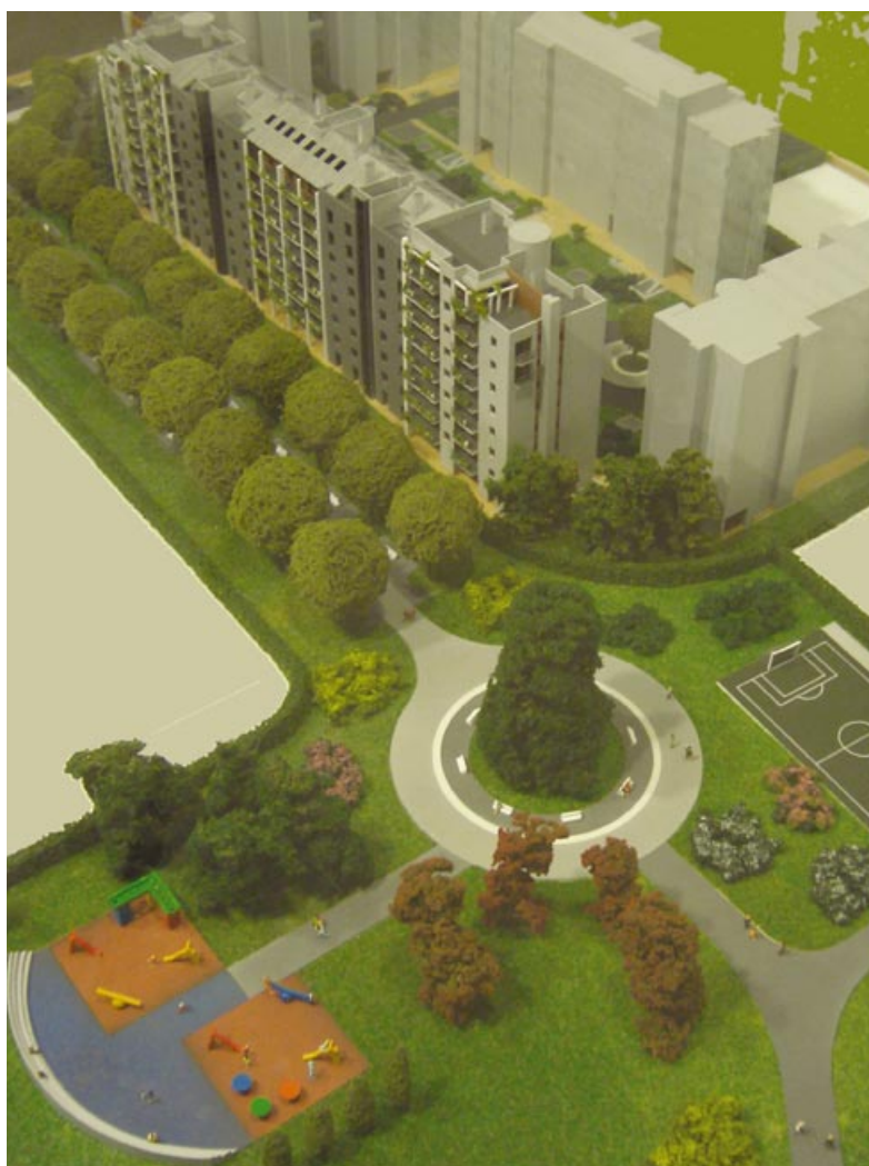
plastico del progetto "Villaggio Cooperativo Grazioli"