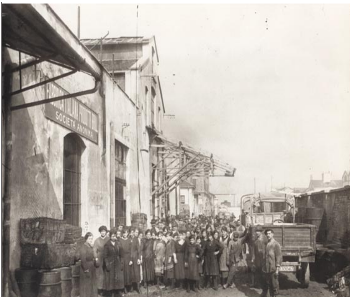
Ex stabilimento Brill, ora cantiere del Villaggio Cooperativo Grazioli

La Cooperativa Edificatrice di Dergano è lieta di comunicare che il 2004 è l'anno del centenario della sua fondazione. In occasione di tale evento è lieta di invitarVi domenica 17 ottobre 04 presso il Centro anziani di Villa Taverna in via Brivio per festeggiare insieme.