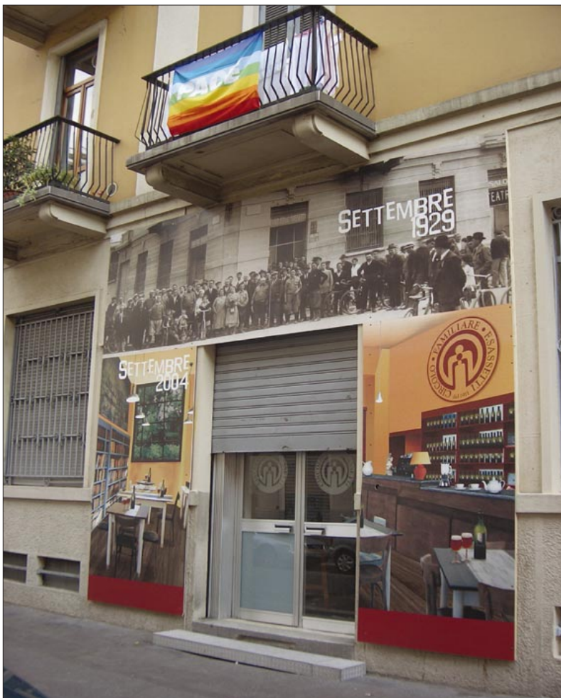
sede del Circolo Filippo Sassetti, via Sebenico

L'augurio che porgiamo a questi nostri Soci è che attraverso il loro impegno, il loro lavoro, e la loro abnegazione possano concorrere a far vivere un luogo attorno al quale si è sempre svolta la vita della popolazione dell'Isola.