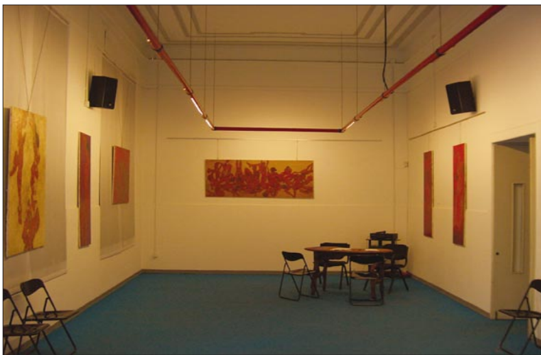
sala espositiva dell'Associazione Sassetti Cultura, via Volturmo 35